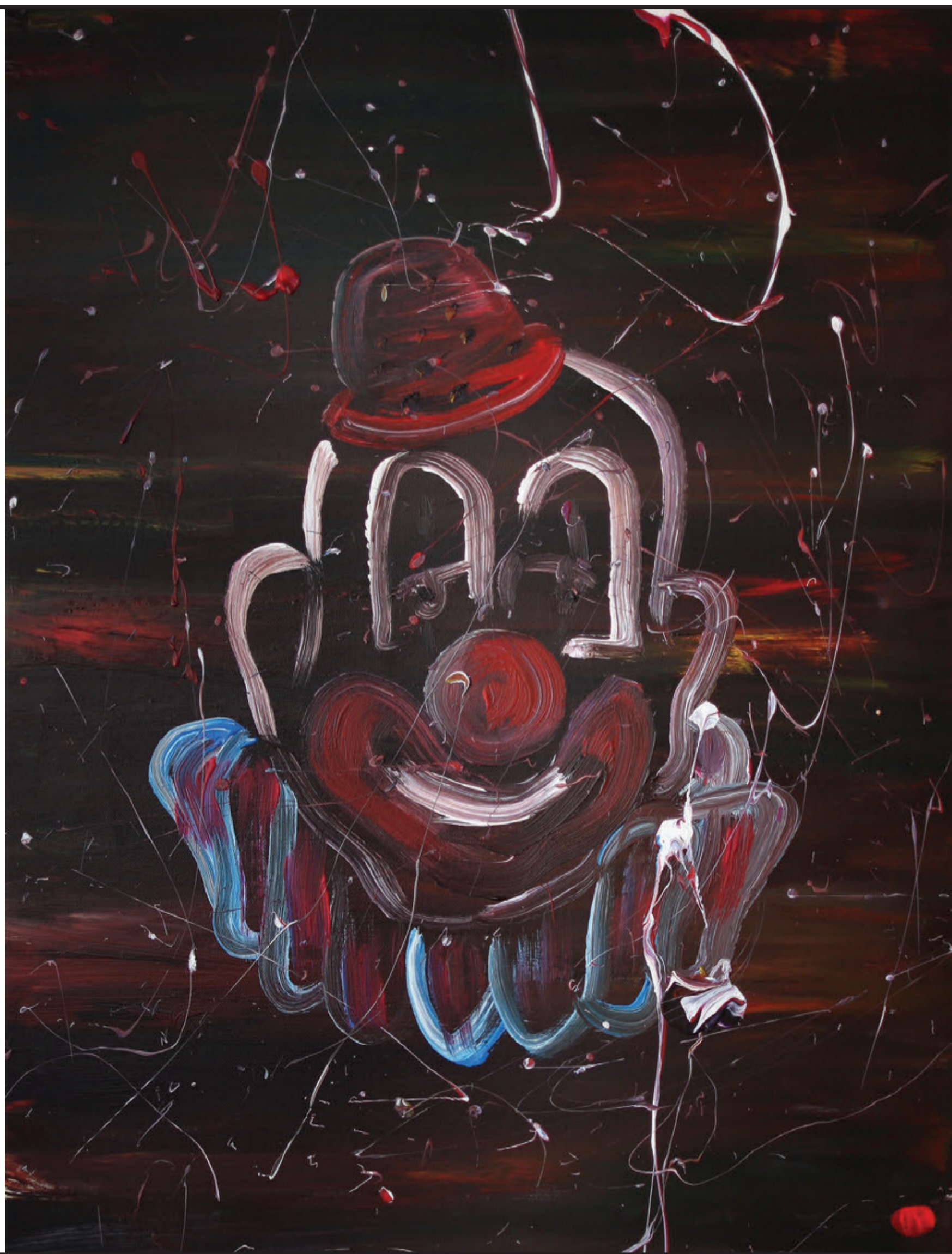
«БЛЯДСКИЙ ЦИРК» ФОРМАТ 60x80см, СМЕШАННАЯ ТЕХНИКА