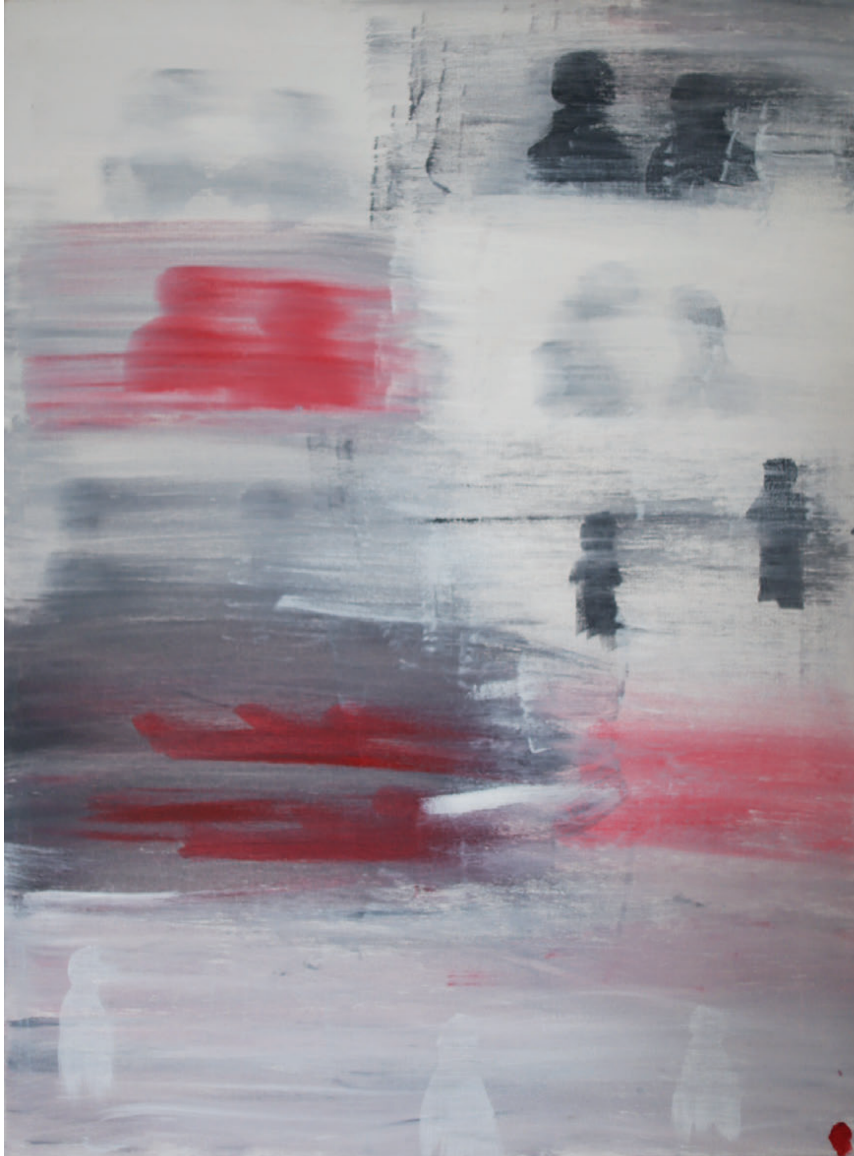
«ТОКИО.ХИКИКОМОРИ» ФОРМАТ 60x80см, СМЕШАННАЯ ТЕХНИКА